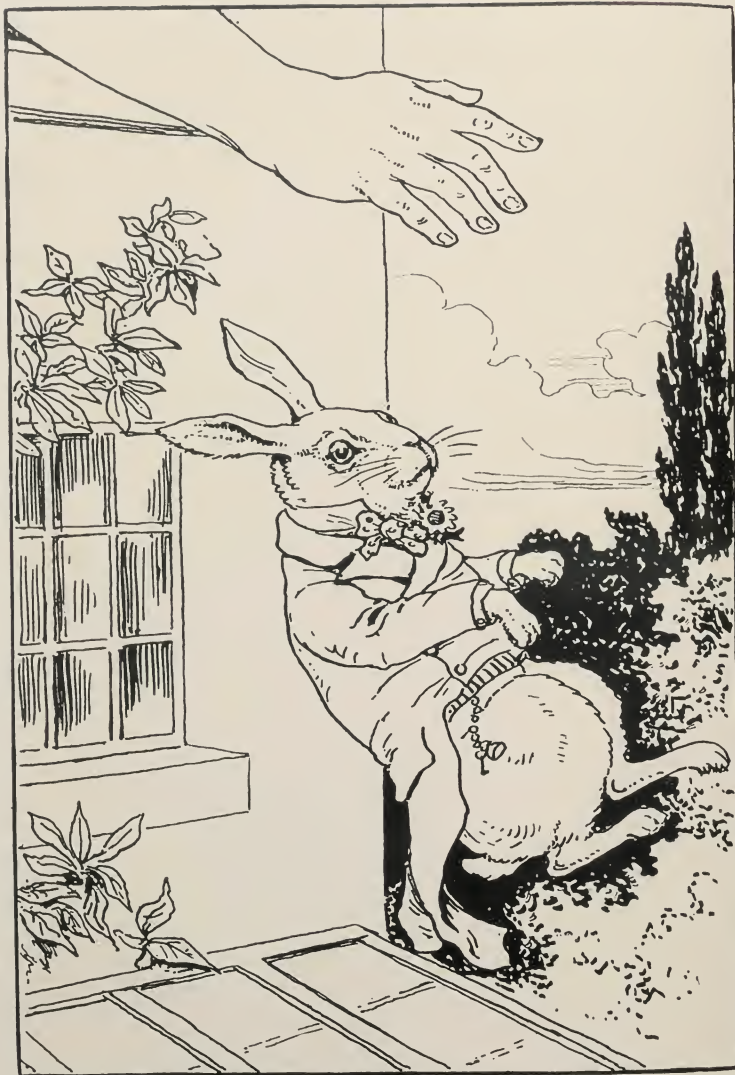
LA KUNIKLO FALAS EN SIAN KUKUMEJON.

spaco por vi , kie do lokiĝus lernolibroj?” Kaj tiamaniere ŝi daŭrigis la konversacion, diskutante kaj argumentante kontraŭ si.